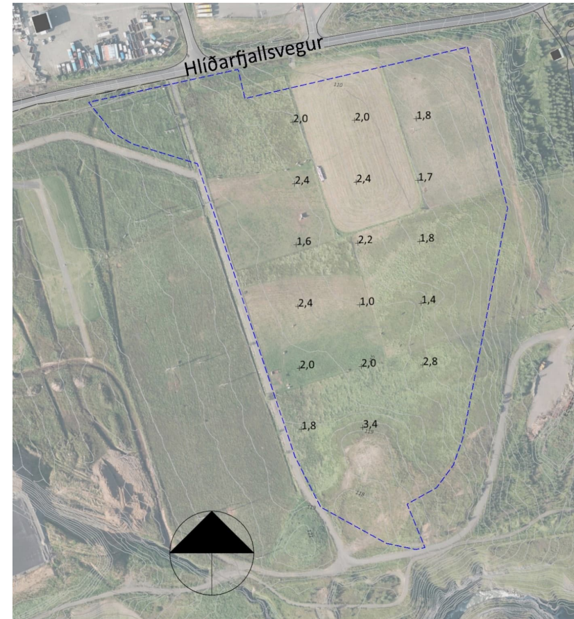
Mynd 3 Niðurstöður mælinga á jarðvegsdýpt á skipulagssvæðinu.

Við undirbúning deiliskipulagsgerðar og framkvæmda á svæðinu var framkvæmd mæling á jarðvegsdýpt með tilliti til byggingarhæfi einstakra lóða. Niðurstöðurnar eru hér að neðan (Mynd 3) og samkvæmt því er jarðvegsdýpt víðast hvar um 2 m.