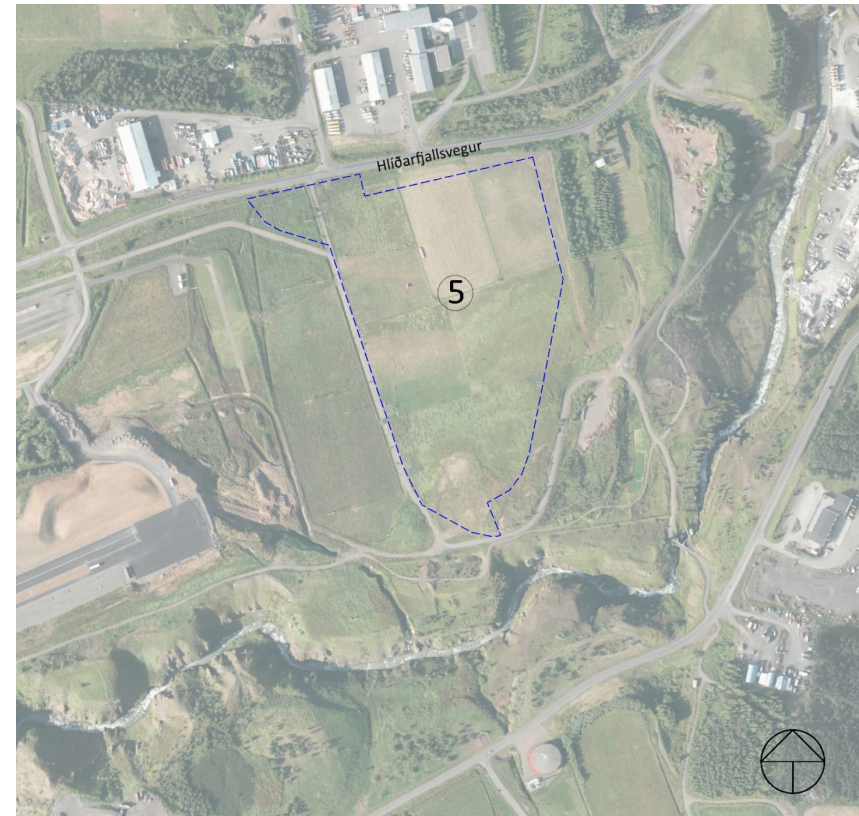
Mynd 1 Skipulagssvæðið, afmarkað með blárrí brotalínu.

um svæðið, þ.e. samsíða Hlíðarfjallsvegi. Þar liggur einnig aflögð kaldvatnslögn.